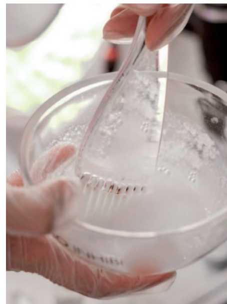
Miscela di acido ialuronico e proteine del riso per ridare lucentezza e vitalità ai capelli

Sicuramente rivolgersi al centro CRLAB dell'Insubria più vicino a te, fissare un appuntamento conoscitivo, effettuare un Tricotest ed affidarsi a chi di capelli ne sa da più di 50 anni.